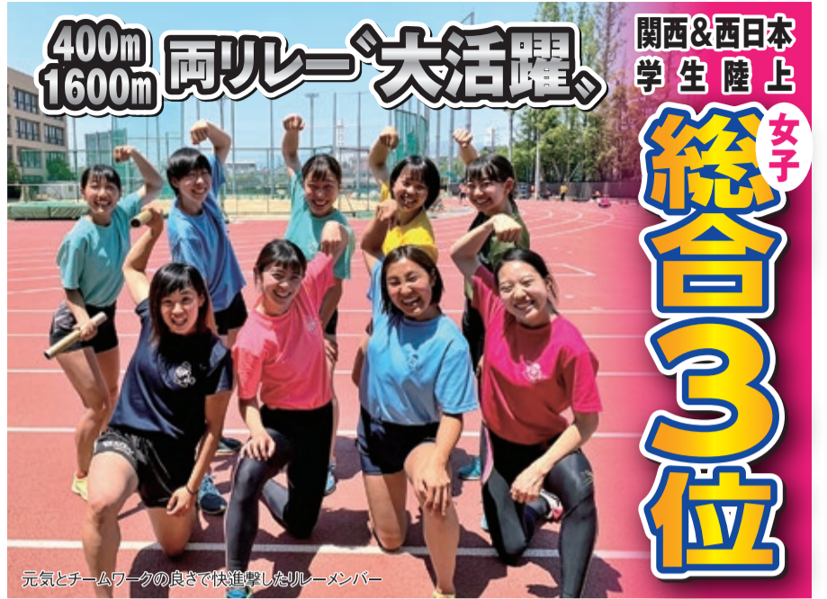
元気とチームワークの良さで快進撃したリレーメンバー

トラックでは400mリレーと1600mリレー、400mハードルの3種目で2位に入った。高校時代に個人種目でインターハイ